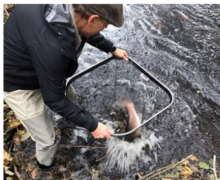
Fångst av lax i Rolfsån för transport till Sörån vid Bollebygd.