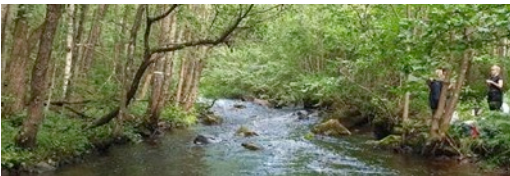
Före och efter åtgärd i Sörån.