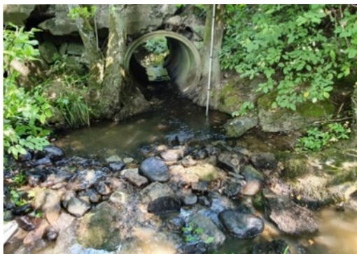
Åtgärdad vägtrumma.